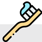
HIGIENE PESSOAL (ESCOVA E PASTA DE DENTES, CHAMPÔ, TOALHA, ETC)