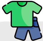
ROUPA E CALÇADO PRÁTICO E CONFORTÁVEL