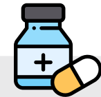
MEDICAÇÃO (CASO O PARTICIPANTE NECESSITE)

Nota: Aconselhamos que os participantes não tragam objetos valiosos. Não nos responsabilizamos por perdas, danos ou desaparecimento de qualquer tipo de pertence. Não é permitida a utilização do telemóvel durante o decorrer das atividades.