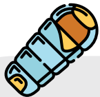
SACO DE CAMA