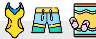
CALÇÕES DE BANHO / FATO DE BANHO E TOALHA DE PRAIA (NO CASO DO PROGRAMA INCLUIR PISCINA)