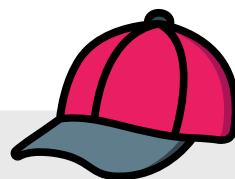
CHAPÉU / BONÉ