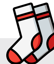
MEIAS ANTIDERRAPANTES (NO CASO DE PROGRAMA INCLUIR INSUFLÁVEL, TRAMPOLINS OU ROPELAND)