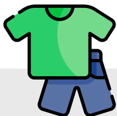
ROUPA E CALÇADO PRÁTICO E CONFORTÁVEL